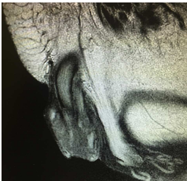
Figura 1 Resonancia magnética. Identificación de la lesión en pene.

diferenciado de tipo verrucoso de 6 cm de diámetro mayor localizado en glándula que infiltra cuerpo esponjoso y uretra peneana, invasión linfática y vascular presente, lecho quirúrgico sin evidencia de células neoplásicas, liquen plano extenso en piel de prepucio y cambios citopáticos asociados a infección por virus del papiloma humano. Se estadifica según la TNMG(AJCC2010*) como (T3,N0,M0,G1). Se decidió realizar linfadenectomía inguinal robot asistida superficial y profunda, sin complicaciones transoperatorias; curso con evolución satisfactoria siendo egresado al día siguiente con la presencia de los drenos que se retiran al día número 10 en consulta externa.