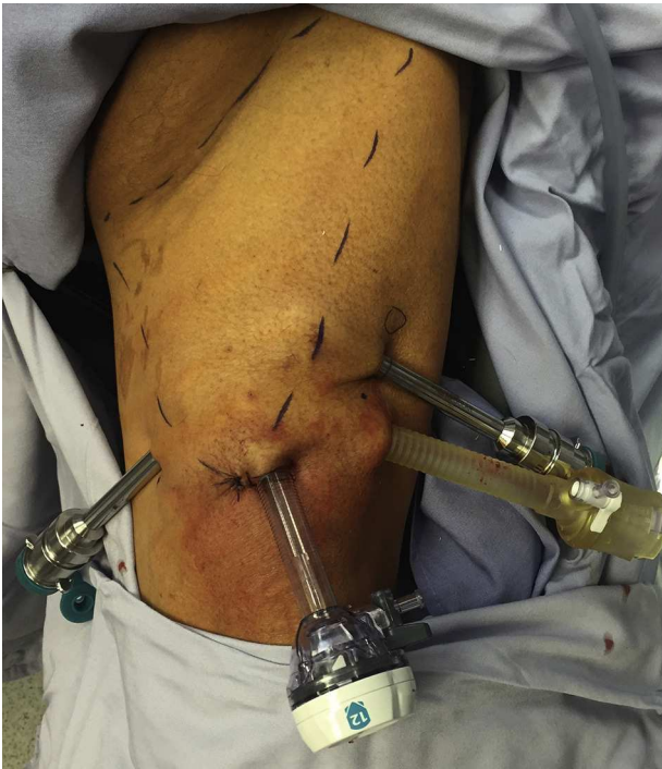
Figura 4 Colocación de trocares e identificación de triángulo femoral.

quirúrgico de 177.5 (132-400) min, un día de estancia hospitalaria (1-12 días), y 25 días de duración del drenaje (8-101 días). La complicación mayor en los pacientes incluyó un reingreso para drenaje, neumomediastino sin secuelas y celulitis superficial.