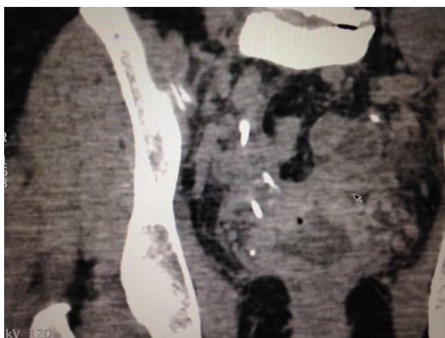
Figura 2 Fistula Uretero Vaginal.